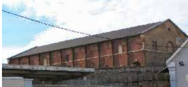
Le pavillon de l'exposition de Paris et un détail de la structure